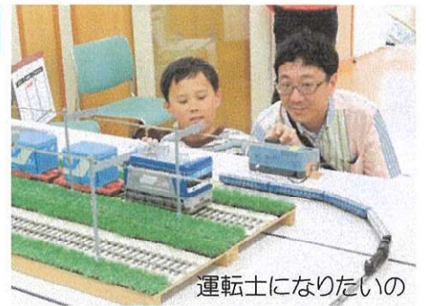
運転士になりたいの