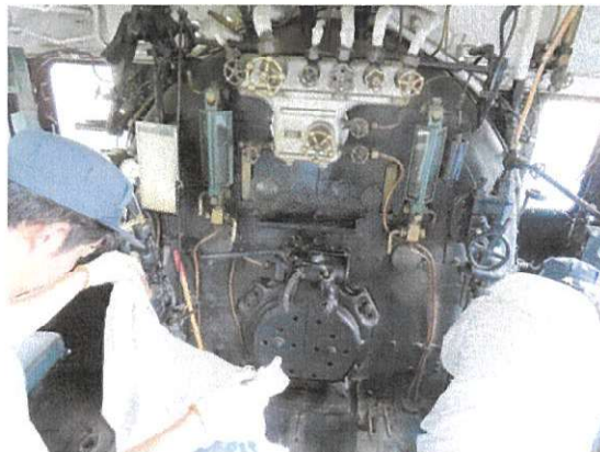
久々の運転席 シート覆いで入りにくい