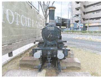
ご近所のSL「225」 ネルソン6200型 真伝町 三河車輛製