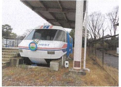
安全祈願 正月飾りつけ正装