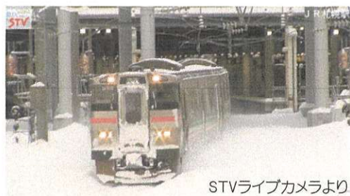
STVライブカメラより