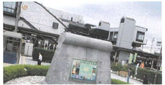
南公園ご近所のSL:昔駅西口に停車していました。 今、この酒屋さんに停車しているのには いわくがあるようで 「角打ち」しながら、ご主人にお聞きしましょう