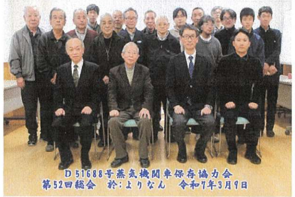
D51688号蒸気機関車保存協力会 第52回総会 於:よりなん 令和7年3月9日