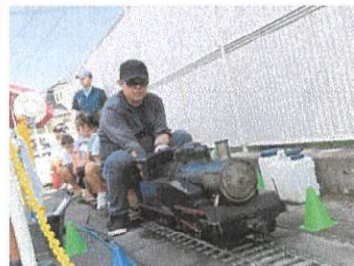
ライブスチーム走行イベント